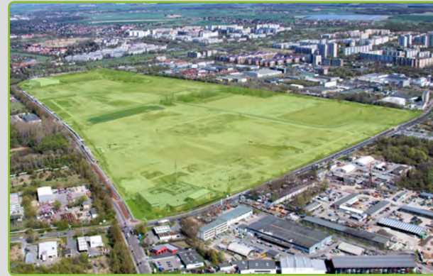
Luftbild CleanTech Business Park