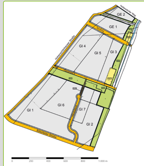
Festgesetzter Bebauungsplan 10-56

BEZIRKSAMT MARZAHN-HELLERSDORF VON BERLIN Leitstelle für Wirtschaftsförderung – ZAK Wolfener Straße 32-34 Haus K, 3. Etage D-12681 Berlin